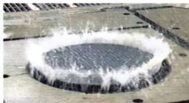
浮上防止ロック機能付きマンホール