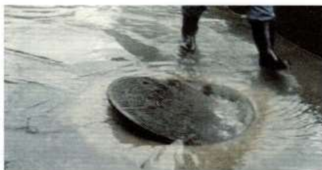
浮き上がってずれたマンホールのふた

大東市では、下水道管に流入した雨で、マンホールのふたが外れない仕組みになっている、 浮上防止ロック機能 が付いたマンホールへの取り替えを平成17年から順次行っています。