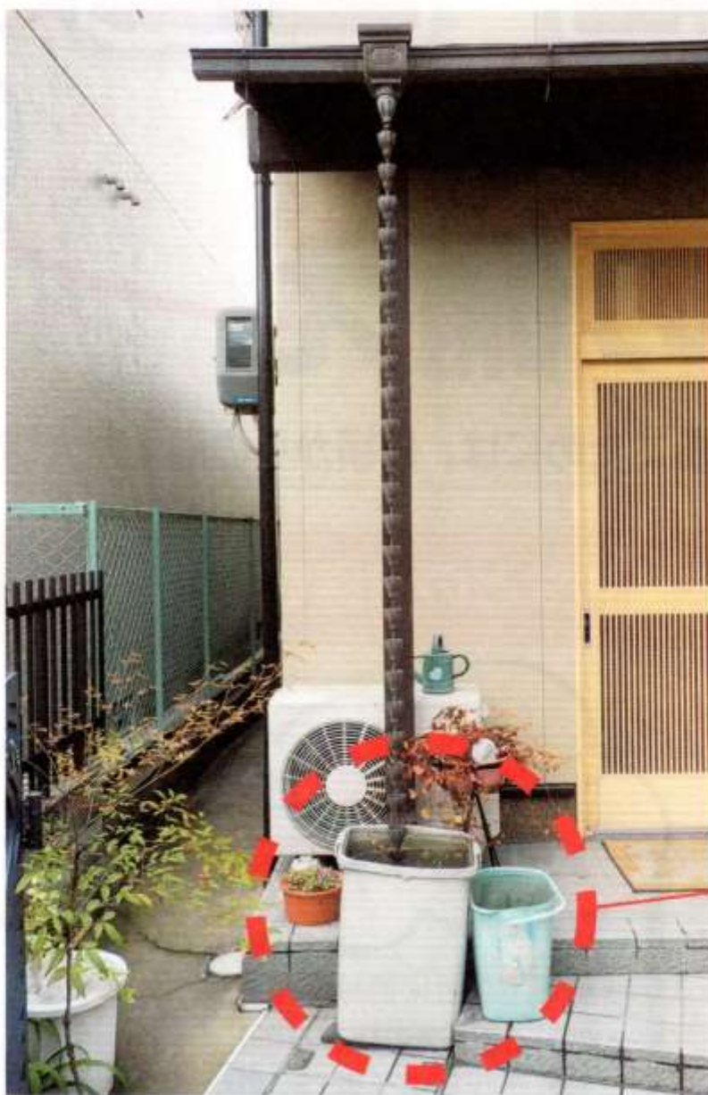
簡易な雨水貯留の方法

大雨の時に雨水が一時に下水道管へ流れ込むのを防ぐことができるので、洪水や浸水の防止になります。