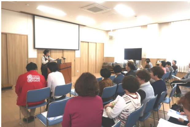
新総合事業の説明