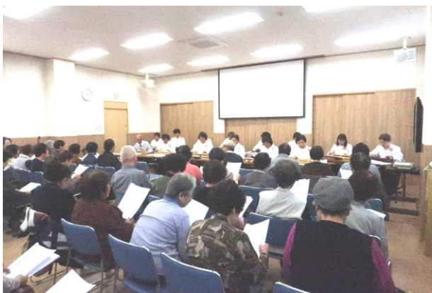
大正琴に合わせて歌いました