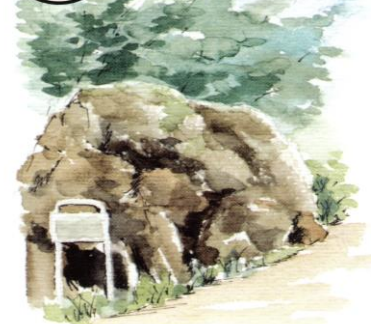
ち 『築城の苦勞を語る 残念石』

大阪城を築城、再建するとき、龍間から石を切り出して運んでいました。何らかの理由で運び込めなかった石を「残念石」と呼んでいます。