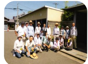
三箇第1老人クラブ (平成 27. 8. 5)