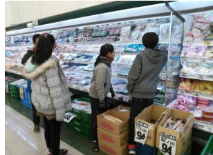
金銭教育(スーパーで買物)

また「金銭教育」におきましては、二年間を大阪府の委嘱校に指定されたことによって、全児童が「お金の大切さ、お金の使い方」を勉強することができたのではないかと思います。