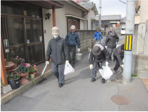
街中健康ウォーキング清掃美化活動中の老人クラブの皆さん