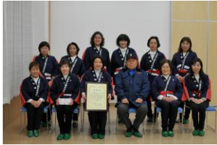
三ツ川区長に表彰を報告 (平成27.2.7)

平成27年1月27日、三箇女性防火クラブは、火災予防活動優秀団体として、大阪府婦人防火クラブ連絡協議会会長から表彰されました。