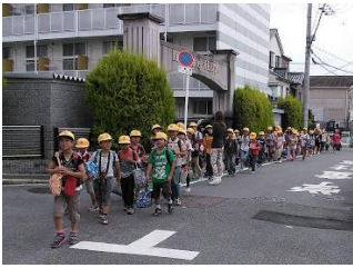
黄帽をかぶって登校

また、行事におきましては、多くの地域の皆様、保護者の皆様のご意見を取り入れさせていただき、徐々に改善していったのではないかと思います。