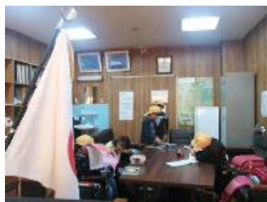
放課後の校長室で学習する児童

子ども達は、このような行事を通して、地域、社会、国家に恩返しができるようになりrippな大人になってもらいたいと願っておりますし、新たに開催いたしました行事を長く続けることによって、「子ども達を高め」、更に「地域と一体の学校」をめざしていってほしいと強く思うところでございます。