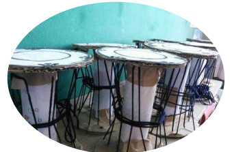
ダンボールで小鼓を作りました

従前からの行事では、一月に五年生のスキー一泊教室がございました。このように、学校には色々な行事がございますが、子ども達にとって、とても大切な位置づけであります。一つひとつの行事を通して、「規律規範」や「社会性」、「道徳心」、「伝統文化」等を勉強いたします。