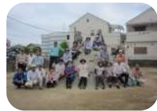
第1老人クラブ(平成27.5.7)