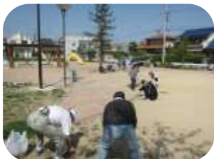
第3老人クラブ(平成27.5.10)