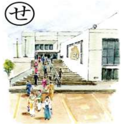
『成人の 門出を祝う サーティホール』

【編集・発行】三箇自治会事務局 〒574-0077 大東市三箇 4 丁目 1 番 5 号 三箇自治会館 TEL072-873-8878