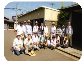
三箇第1老人クラブ (平成 27. 8. 5)