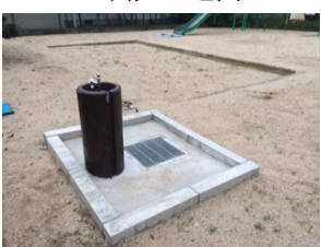
上三箇第4児童遊園