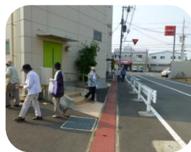
三箇第5老人クラブ(平成 27. 8. 3)