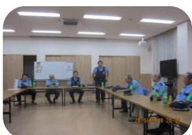
四條畷警察署員の指導

平成27年度第3回防犯警戒（夜間パトロール）を8月8日(土)午後8時30分から防犯委員第3班により実施しました。次回は、9月12日(土)に実施予定です。