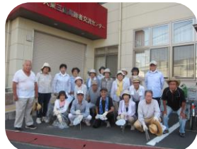
三箇第3老人クラブ (平成 27. 8. 9)