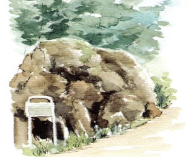
ち 『築城の苦勞を語る 残念石』

大阪城を築城、再建するとき、龍間から石を切り出して運んでいました。何らかの理由で運び込めなかった石を「残念石」と呼んでいます。