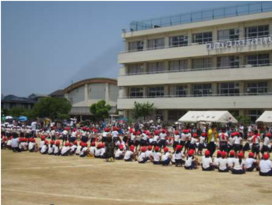
三箇小学校運動会(仲良く引こう！友情の綱)