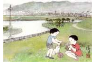
大東八景・萌える草地「深北緑地」

[編集・発行]三箇自治会事務局 〒574-0077 大東市三箇4丁目1番5号 三箇自治会館 Tel.072-873-6888