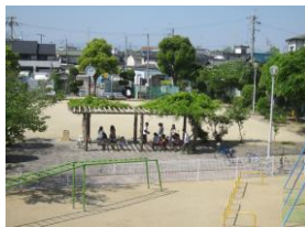
三箇第3公園(三箇4丁目)

私たちは、それから複数回「三箇探検隊」と勝手に称して、三箇のまちを巡りました。驚いたのは、夜間、日中、真夏、真冬・・・いつ廻つても役員の方に偶然、道端でお会いすることです。いかに日頃から地域を歩いておられるのか、ということでしょう。そのたびに、今日はどうしたんや」と声を掛けてくださいました。