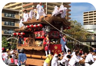
江ノ口北若中地車会