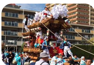
大箇だんじり会若中