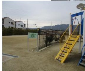
三箇第1公園(三箇6丁目)

私は、自分の仕事(業務)においては、部分的ではありますが、プロジェクトであると思っております。また、私は、生まれも育ちも大東で、結構、大東市のことは知っていると思っております。