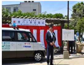
新青パト車・出発式

悪い所など見つからない、というのが本音なのですが、もつともつといい地域にしたいという想いがあふれていて、地域の外から見ることでできる地区担当職員の立場を深く理解された上でのご発言だったのであらうと思います。