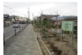
住道四の宮線緩衝緑地

今後、地区担当職員の任期が終わつても、どの部所で働くにしても、人々の生活がそこにある。」という当たり前のことを忘れず、一方向的な思い込みで政策を進めることのないよう心掛けたいと思います。