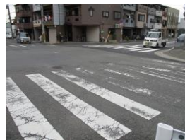
横断歩道のマーキング