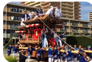
江ノ口南若中保存会