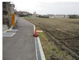
整備後の中戸水路・歩道