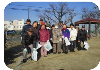
三箇むつみ会(平成29.2.4)・健康ウォーキング清掃