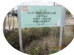
アドプト制度標示板

悪い所など見つからない、というのが本音なのですが、もつともつといい地域にしたいという想いがあふれていて、地域の外から見ることでできる地区担当職員の立場を深く理解された上でのご発言だったのであらうと思います。