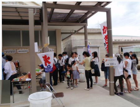
昨年度の風景です。

7 月 7 日（土）11 時から深野中学校において「ふこのフェスタ・スポーツ&カルチャー」が開催されます。三箇地域コミュニティ市民会議、三箇校区福祉委員会、三箇子ども会ではかき氷、フランクフルト、ミルクせんべいを販売し盛り上げます。皆さん是非見て、食べに来てください。