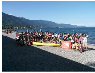
琵琶湖のカヤック体験