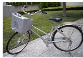
ひったくり防止カバー