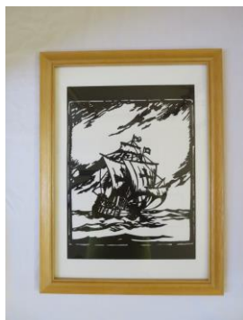
切り絵「船」 杉岡正夫