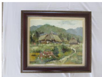
油絵「京都美山」 宮崎静子