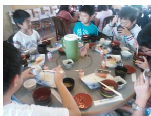
楽しい朝食タイム