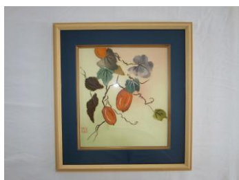
ちぎり絵「鳥瓜」 三ツ川スミ子