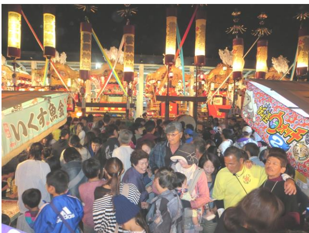
三箇菅原神社・平成26年10月19日

毎年のことですが、防犯委員の皆様には、宵宮を誰もが安心して楽しめるように周辺の警備をお願いしています。幸い当日は事故もなく、大勢の人に賑やかな秋祭りのひと時を過ごしていただくことができました。大変ご苦労様でした。