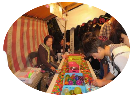
▲スーパーボールすくい