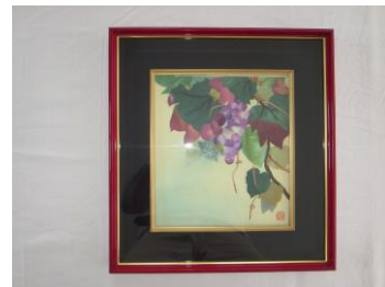
ちぎり絵「葡萄」 有友悦子