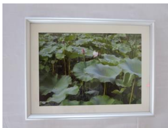
写真「深北緑地」 三ツ川 勇