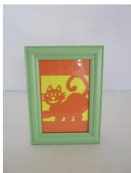
切り絵「ネコ」 山本文男