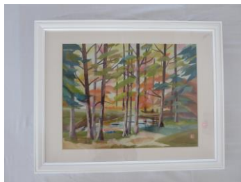
ちぎり絵「秋の林」 狭山和子