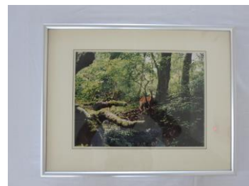
写真「屋久鹿」 羽生薫章