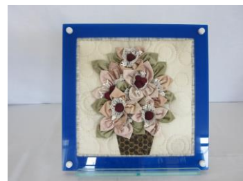
パッチワーク「タペストリー」 小林カ津子